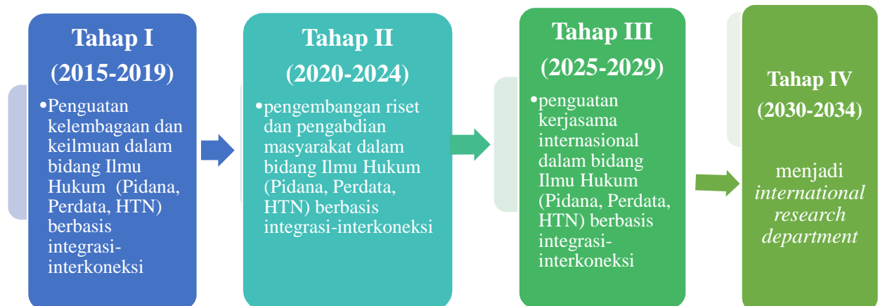
Gambar 3. Rencana Kerja dan Tahapan

Berikut rencana kerja dan tahapan pada setiap periode tahun: